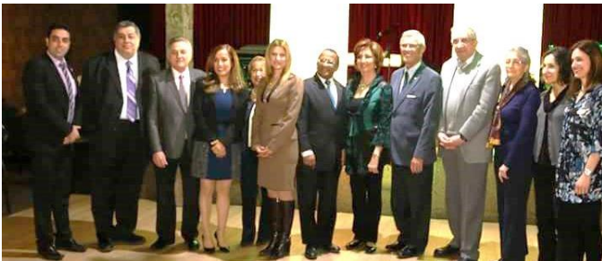
Les dignitaires invités

Cinq kiosques de service pour informer sur des services bancaires, des couvertures d'assurances, des offres d'emploi, des cours de conduite auto nécessaires à l'obtention de permis, des services d'immigration, location, écoles, etc.