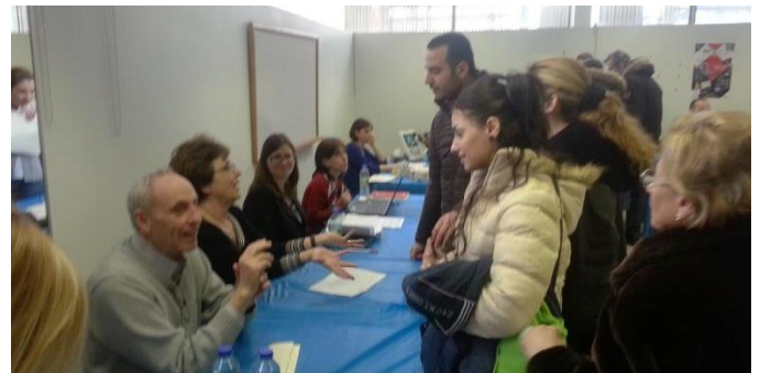
Nos bénévoles accueillent les familles

Notre second cocktail de Bienvenue eut lieu le 18 avril 2016 au Centre Communautaire Bordeaux-Cartierville et accueillait 42 familles nouvellement inscrites. Elles purent se retrouver avec nos bénévoles et profiter de la présence d'une équipe d'Emploi-Québec, de la Banque Scotia, de Concertation Femme et de conseillers en informatique.