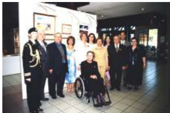
Le conseil d'administration reçoit l'honorable Lise Thibault à son arrivée au Centre de Loisirs de Saint Laurent

L'honorable Lise Thibault a ajouté à la soirée distinction et prestige.