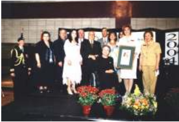
Les membres du conseil de l'Entraide recevant des mains de l'honorable Lise Thibault un hommage.

M. Yvan Bordeleau fit part à son tour de son admiration pour le travail accompli et profita de l'occasion pour remettre à la présidente de l'Entraide la médaille de l'assemblée nationale du Québec.