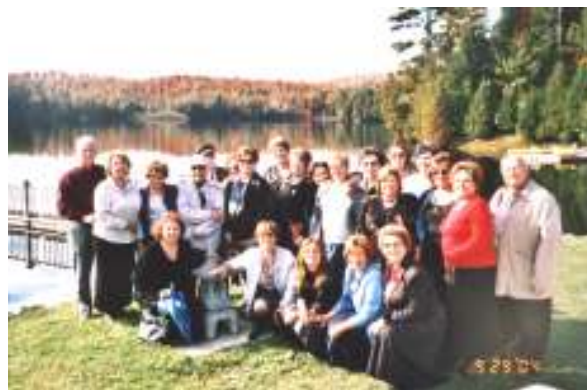
Journée féerique au bord du Lac Carling

Visite intéressante de la chandellerie et des ateliers, de la ferme, de la salle d'exposition des articles d'artisanat.