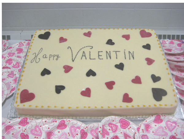
Le grand gâteau traditionnel de la Saint-Valentin