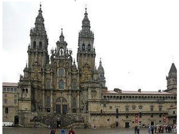
La cathédrale de Saint-Jacques-de-Compostelle, ultime étape du pèlerinage

Mais les plaisirs les plus durables sont les plaisirs les plus primitifs et marcher seul ou accompagné conserve cette belle et jeune richesse.