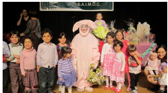
Lapinot et les enfants du printemps