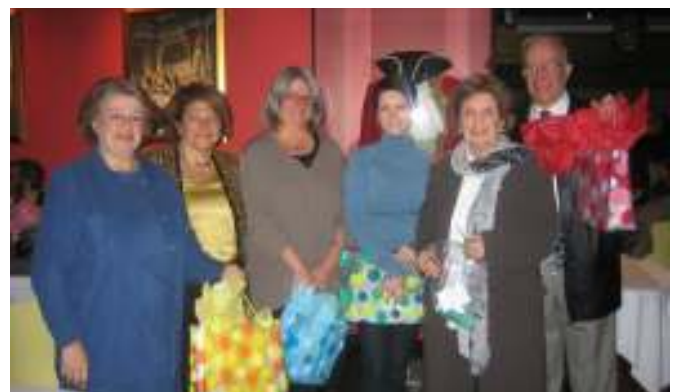
Les gagnants des prix de présence

La dernière saison de ballet à la Place des Arts a été très prisée de nos membres. Ceux qui désirent réserver pour la saison 2006-2007 sont priés de contacter Mme Charlotte Mallouh au 488-8679 avant le 15 juin.