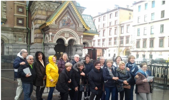
À Saint-Petersbourg devant l'église du Sang Versé

Nous étions trente membres de l'Entraide, la caravane des gens heureux, qui nous a menés cette année découvrir un nouveau pays longtemps ignoré, mais qui a meublé une page de notre culture. Le poète Pouchkine, les romanciers Dostoïevski et Tolstoï, les musiciens Rimsky-Korsakoff et Tchaïkovski pour ne citer que quelques grands. Nous avons visité le Bolchoï, les palais des tsars, la belle cathédrale de Saint Basile sur la Place Rouge et le Kremlin. Il serait long de décrire ce pèlerinage chargé d'émotion, mais voici quelques impressions glanées sur le tas.