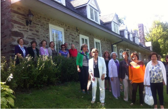
Sur la pelouse de la Maison Trestler