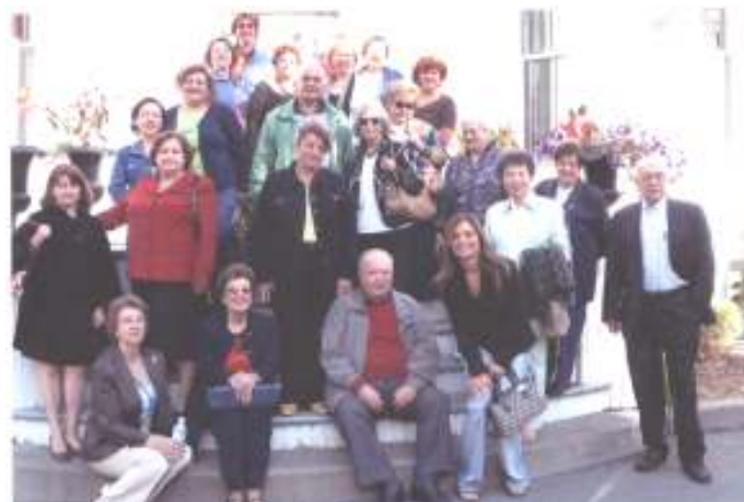
Par une belle journée d'automne...

Notre sortie culturelle de l'automne, le 20 septembre, nous a emmené à St-Eustache où nous avons visité le musée situé dans le magnifique Manoir Globensky où un guide nous a exposé l'histoire et la légende des Patriotes.