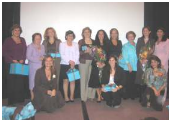
Les heureuses gagnantes des cadeaux du tirage de Birks

En conclusion, la beauté et le luxe étaient au rendez-vous : goût raffiné, élégance, belle musique jouée par notre harpiste, excellent repas. Tout était vécu dans la bonne humeur. La maison BIRKS a pu présenter ses nouvelles créations de beaux bijoux. Un cadeau-souvenir fut aussi offert à chacune des dames qui assistaient à l'évènement.