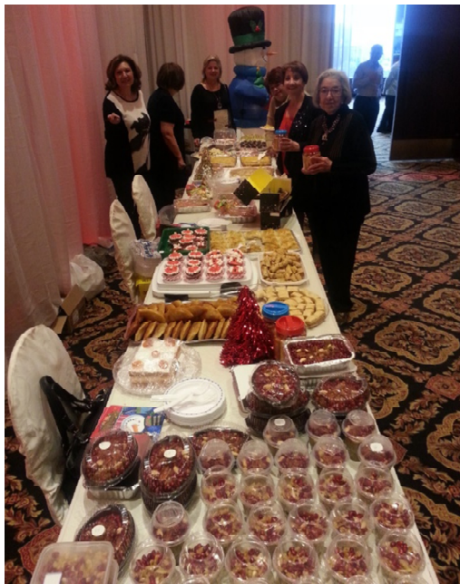
La belle table de douceurs

Depuis un ou deux jours les enfants attendaient impatiemment à rencontrer Olaf et la magie de le voir ajoutait à la féerie des Fêtes. Le magicien avec ses lapins et ses colombes a aussi enchanté les enfants.