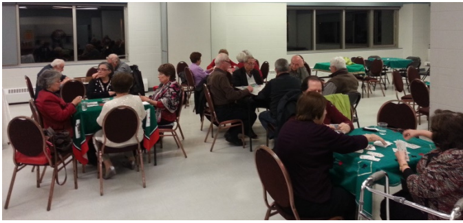
Une soirée agréable entre amis le 2 décembre 2015