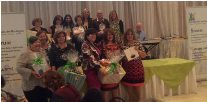
Les gagnantes des cadeaux de la loterie

Venu exprès de Bromont pour l'occasion, il a raconté son parcours et comment il a fondé son entreprise maintenant connue à travers l'Amérique du Nord. Avec des plantes médicinales et par des procédés naturels il est arrivé à distiller des centaines d'huiles essentielles différentes. Il offre ainsi le meilleur d'une grande tradition d'huiles, essences et parfums dans un respect de l'écologie et une conscience environnementale afin de préserver les richesses de notre Terre pour les générations futures.