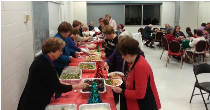
Un bon souper à 19h

Entraide Bois-de-Boulogne vous invite cordialement à assister à la conférence intitulée :