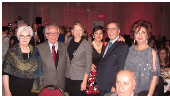
Mme Mélanie Joly, ministre du patrimoine a fait le tour.