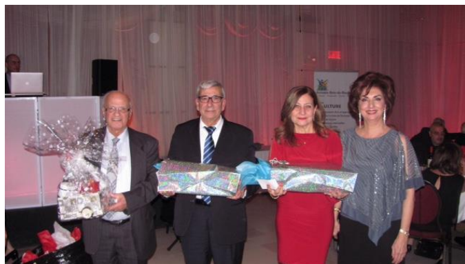
Les gagnants des prix de présence