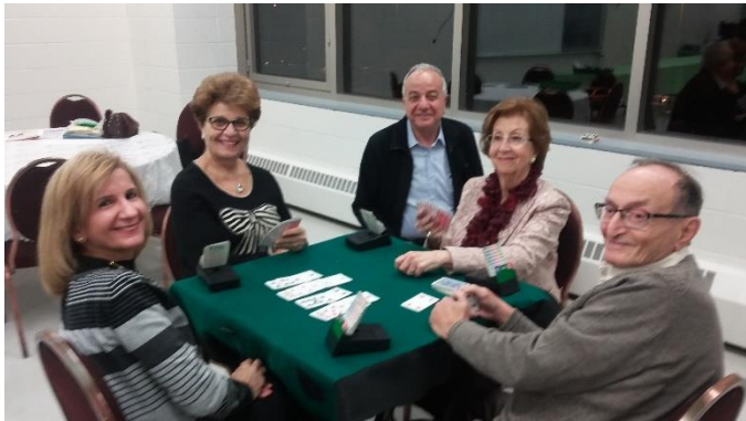
Les joueurs de Bridge

Nous essayerons de répondre à la demande générale et tenir plus souvent cette belle activité.