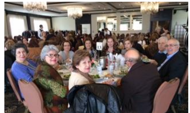
Bienvenue aux Messieurs