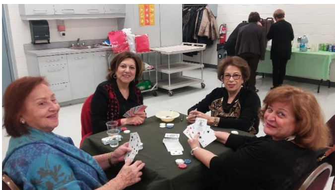
Les beaux sourires d'un quatuor