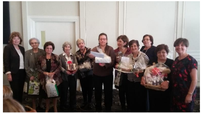
Les heureuses gagnantes des prix de la tombola