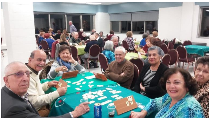
Nos membres toujours fidèles au rendez-vous