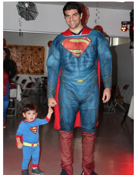
Deux générations de Superman

Le 30 octobre dernier 40 enfants et leurs parents ont joui d'un après-midi agréable et plein d'émotions dans une fête d'halloween animée par Super-Man, Captain America et Darth Vader. Après un bon repas il y a eu des lootbags et beaucoup de jeux amusants.