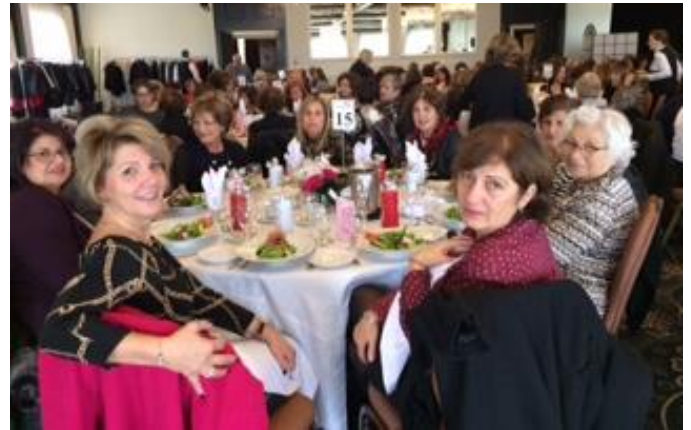
Un bon repas et des visages souriants