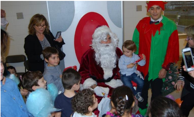
Père Noël et son lutin distribuant des cadeaux aux enfants

Une occasion de raconter les multiples légendes entourant cette sainte du 4 e siècle, une sainte de chez nous, persécutée par son père centurion romain qui refusait que sa fille se convertisse. Une occasion de se rassembler autour d'un plat de blé 'Bélilah / Amhé' dans une atmosphère de fête et de joie, sans oublier le Père Noël qui a fait un tour et qui a offert un cadeau aux enfants.