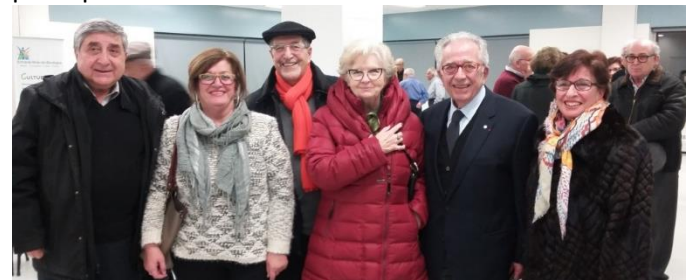
Les membres de la famille Ayoub

Pour les États-Unis il est important de préserver son autosuffisance, car son indépendance et la sécurité de ses approvisionnements sont vitales. Les flux pétroliers doivent s'effectuer normalement (sans embargo, sabotage, terrorisme) et à un prix raisonnable. Le pétrole n'est pas une matière première ordinaire, mais est considéré un produit stratégique et son exportation est soumise à des raisons géostratégiques, économiques, politiques.