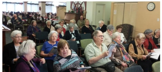
Plusieurs de nos membres sont heureux au Manoir de Casson