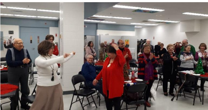
L'atmosphère était heureuse et on a dansé au son de la belle musique