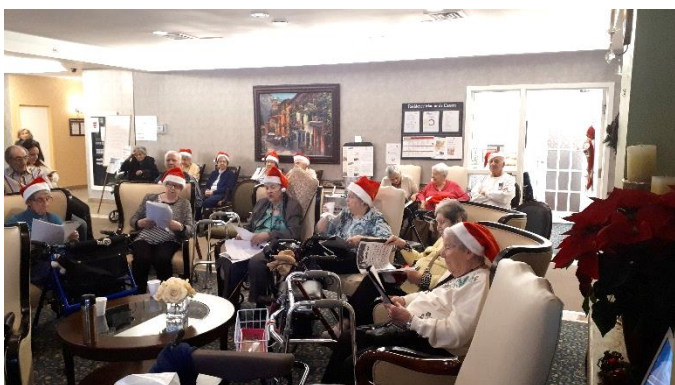
Tout le monde était heureux de porter son bonnet rouge