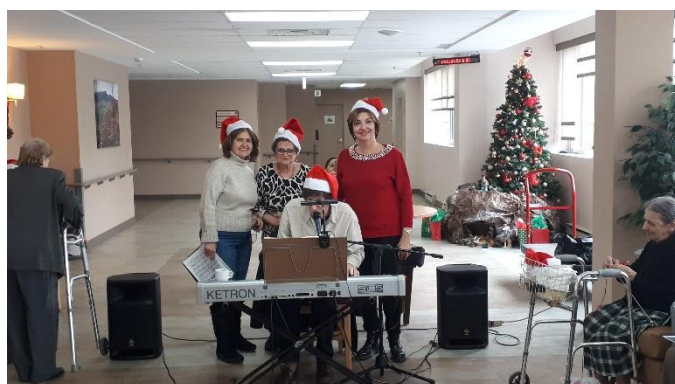
Le Comité des visites aux aînés vous souhaite un très Joyeux Noël et vous invite à participer aux prochaines visites