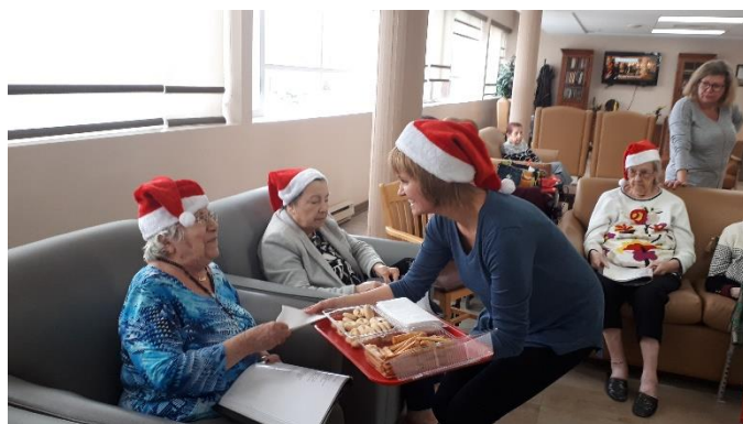
Tout le monde a dégusté les bonnes pâtisseries offertes par l'Entraide