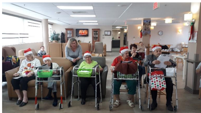
Avec les cahiers de chants en main, nous avons formé une belle chorale