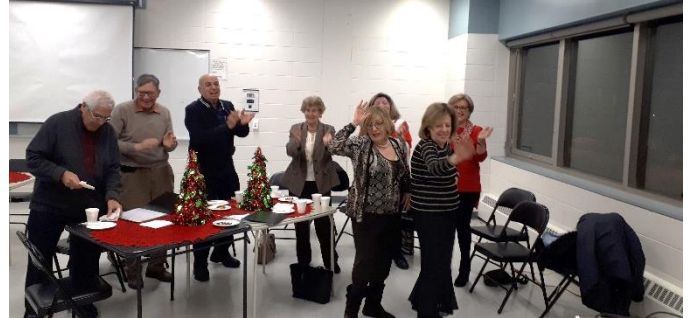
Tout le monde à la danse