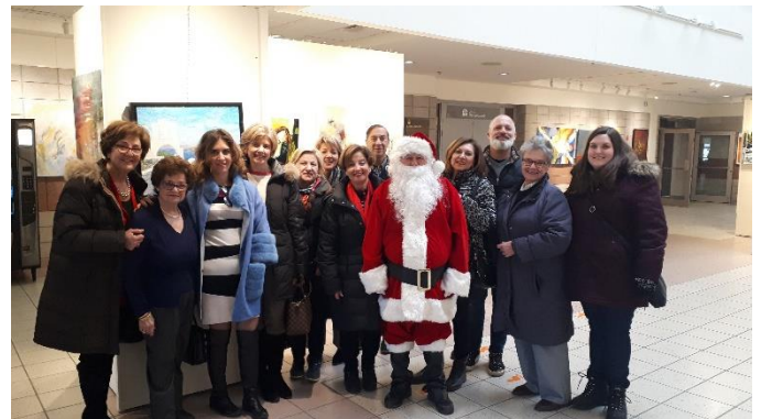
Les bénévoles de l'Entraide avec les bénévoles de CedarCan à la remise des paniers de Noël le 1 er décembre 2019

Une tradition maintenant depuis plusieurs années, cette belle collaboration entre l'Entraide et CedarCan. Nous avons offert 11 paniers de provisions pour plusieurs mois, bien garnis, aux familles démunies et malades. Les bénévoles de CedarCan se sont chargés de les livrer aux patients.