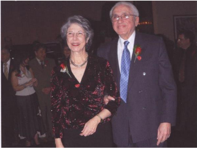
La soirée de la Saint-Valentin de l'Entraide 2006 offrait l'occasion de fêter leur 50 e anniversaire de mariage

En 1966, il émigra tout seul à Montréal sans sa famille. Grâce à Immigration Canada, il reçut trois jours plus tard deux offres d'emploi dont celle de Miron. Cinq mois plus tard il fut rejoint par sa famille une fois sa situation financière bien rétablie.