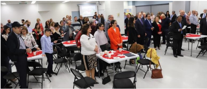
Toute l'assistance s'est mise debout pour entonner ensemble l'hymne national O' Canada!

La vague de nouveaux arrivants syriens en 2016 a été accueillie par les québécois avec enthousiasme et l'Entraide a participé avec les autres intervenants à faciliter leur venue dans les circonstances difficiles marquées par la guerre au Moyen-Orient. Ils se sont vite adaptés à leur nouvelle vie ici, travaillé, étudié et finalement obtenu leur citoyenneté canadienne. À cause de la pandémie la célébration de leur succès n'avait pas eu la fête qu'elle méritait et l'Entraide Bois-de-Boulogne a donc saisi la première occasion pour souligner cette heureuse occasion.