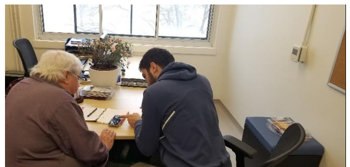
Avec le téléphone cellulaire

Les ateliers sont donnés au Centre culturel et communautaire de Cartierville (4C).