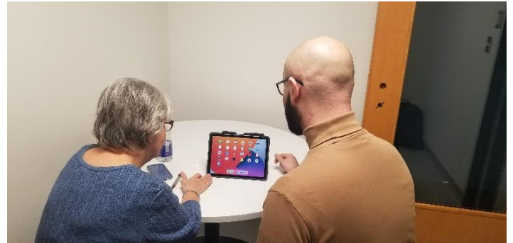
Avec la tablette

Les récipiendaires des bourses de l'Entraide offrent à nos membres des ateliers de formations individuelles adaptées aux besoins de chacun. Si vous avez besoin d'un coup de pouce avec votre tablette ou téléphone intelligent, contactez-nous par courriel et nous ferons le jumelage avec un boursier.