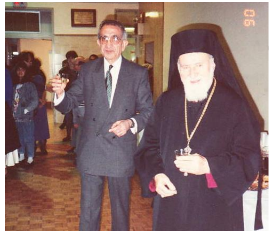
À la santé de la Communauté

HS Nous avons ouvert un bureau de la SAIMOC, maintenant l'Entraide Bdb, pour l'accueil des nouveaux immigrants, le Foyer y organisait des activités sociales, nous avons encouragé les anciens du Collège St-Marc pour y faire du sport, accueilli le Cercle Héliopolis, la troupe théâtrale El Chark, les anciens du Collège patriarcal. Le groupe des aînés était très actif au sein de l'Anneau d'Or et d'Argent, les enfants heureux à la Garderie Bois-de-Boulogne, sans oublier la Messe dominicale et beaucoup d'autres initiatives.