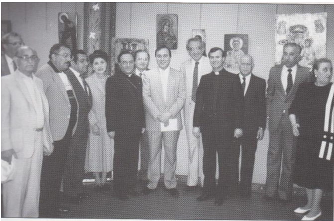
L'Hon. Joseph Ghiz, premier ministre de l'Île-du-Prince-Édouard, visite le musée byzantin au Centre Communautaire Bois-de-Boulogne.