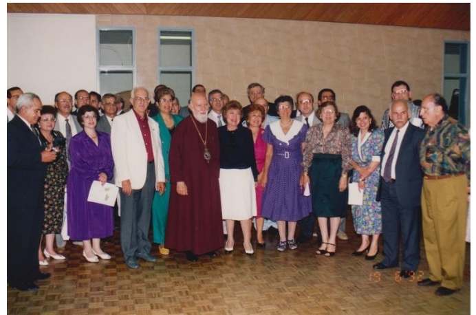
S.B. Maximos V aimait le Centre Communautaire, se sentait chez lui, et les gens le sentaient.