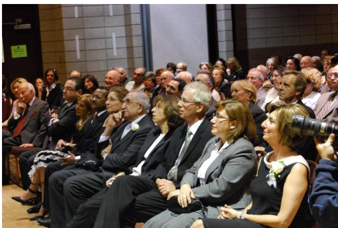
Au cocktail des bénévoles en septembre, à la première rangée entouré des dignitaires invités

La SAIMOC/ Entraide Bois-de-Boulogne nous avait précédés six mois plus tôt sur le même chemin. Elle avait été sortie elle aussi par la nouvelle administration du Centre. L'Entraide Bois-de-Boulogne a donc récupéré avec joie une équipe de bénévoles déçus et des membres actifs toujours enthousiastes.