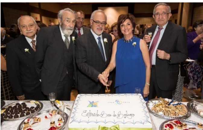
Au cocktail des bénévoles en septembre avec Sénateur Prudhomme et le Ministre Carlos Leitao