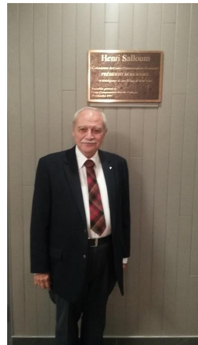
Plaque dans le hall d'entrée du Centre Communautaire