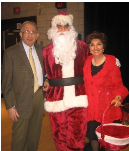
A la Fête annuelle de la Sainte-Barbe les enfants aiment toujours voir arriver le Père Noël avec ses cadeaux