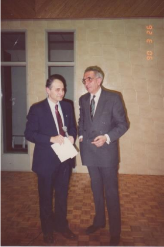
Il était ferme sur ses principes

par-dessus et disait : "pardonne-nous nos offenses..... et ne nous soumet pas à la tentation mais délivre-nous du mal, amen".