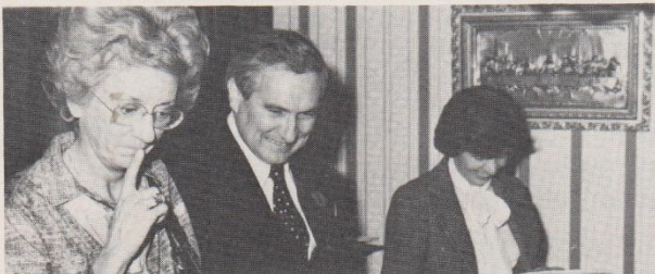
Que ces plats inconnus sont donc tentants !

Le 25 octobre, pour marquer son quinzième anniversaire, la Société d'Aide aux Immigrants du Moyen-Orient du Canada, a invité à un vin d'honneur, au Centre Bois-de-Boulogne, l'Hon. Bud Cullen.