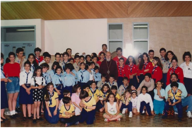
Les scouts du Centre regroupés autour de Sa Béatitudo Maximos V Hakim.