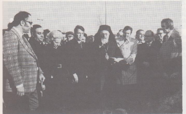
La "Première pelletée de terre" du Centre Communautaire Bois de Boulogne, sur l'Acadie. Vue du terrain et des fidèles.